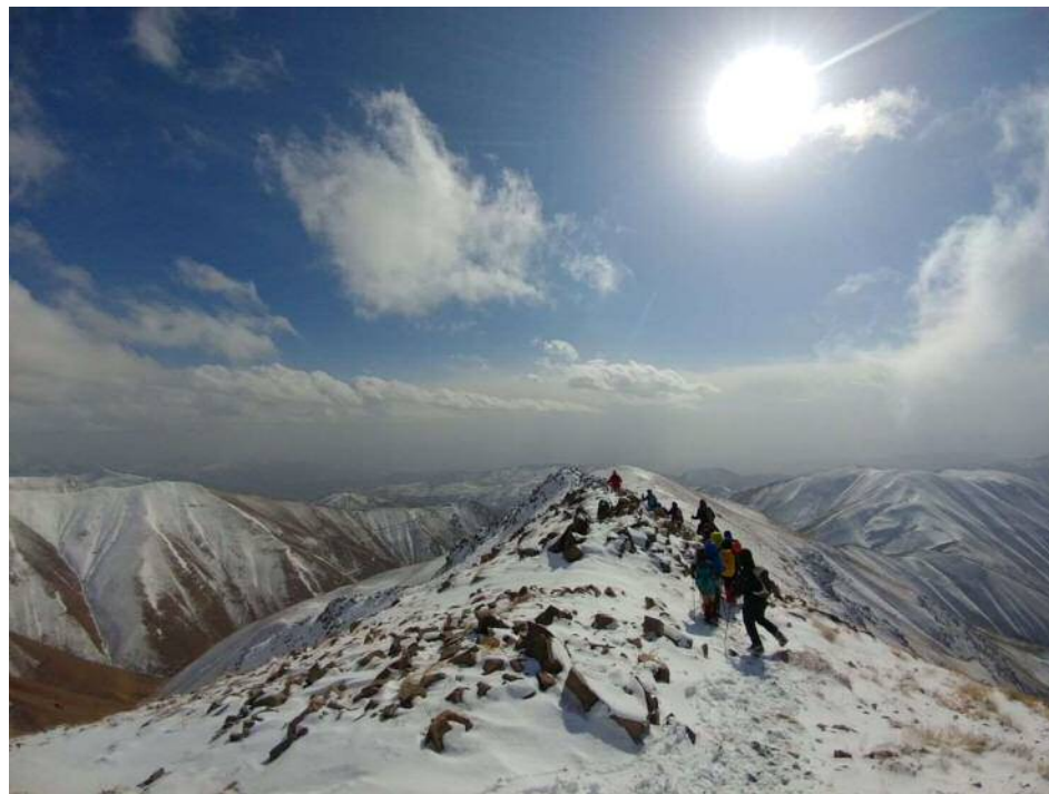
عکس های برنامه: